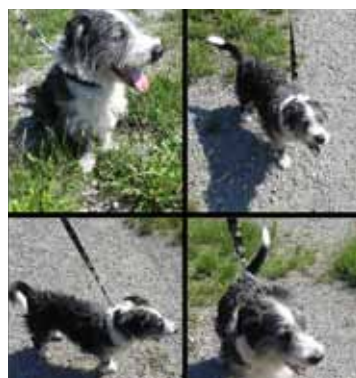
REK, pes, 5 let, šedobílý.