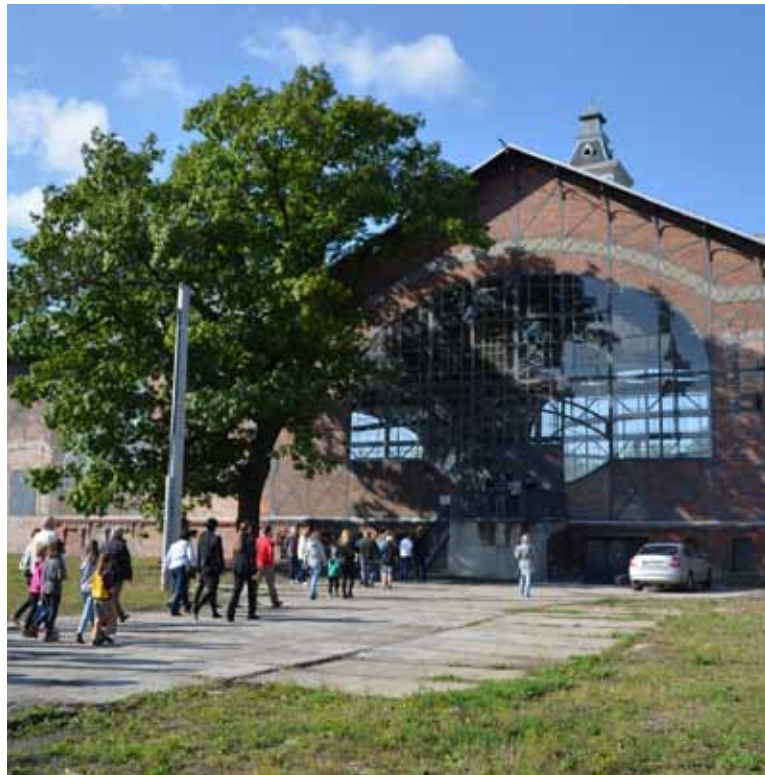
Státní podnik Diamo výjimečně pro Dny evropského dědictví zpřístupní opět po roce areál bývalé šachty Barbora v Dolech včetně těžní věže, a to v sobotu 10. září od 10 do 16 hodin. Zazpívají tam před polednem i Permonici.

Dny, místa a časy prohlídek na www.karvina.cz a www.zamek-frystat.cz .